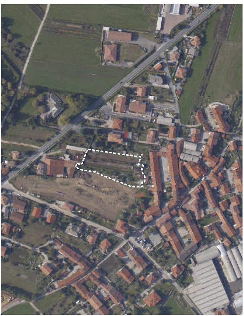
TAVOLA N. 4 SCALA 1:500